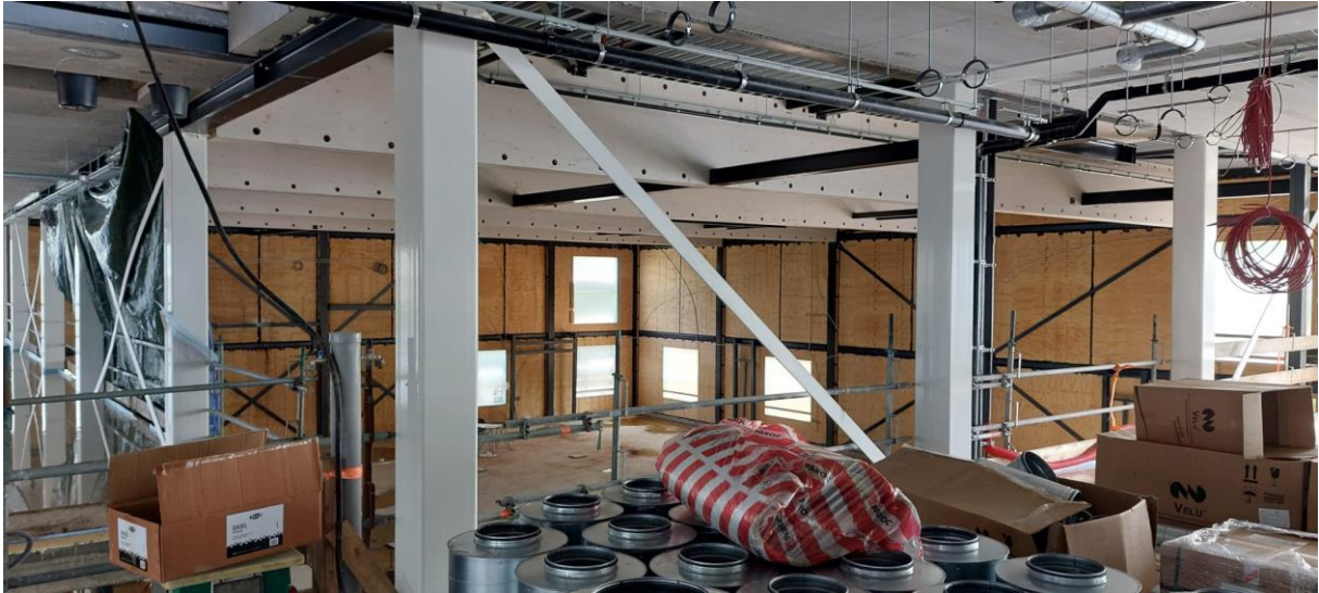
De dubbele gymzaal. In het midden komt een elektrische scheidingswand. De houten liggers in het plafond blijven zichtbaar, ook in de aula.