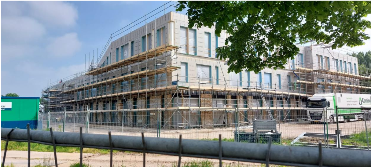
Vooranzicht vanaf de Bachlaan, in het midden aan de linkerkzijde komt de hoofdingang.