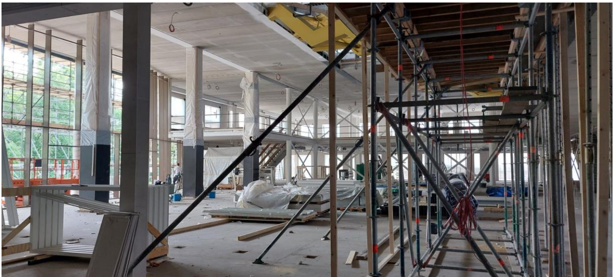
De aula, nog ingepakt en in de steigers.