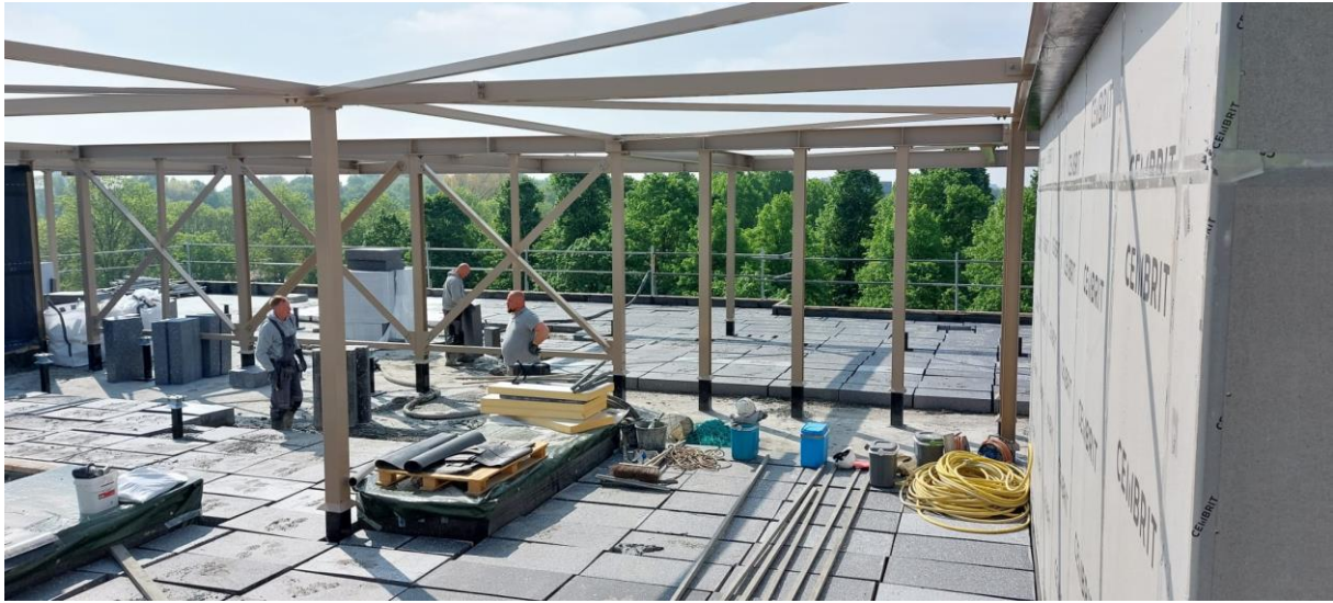
Zicht op het dakterras, hier komt een buitenlokaal.