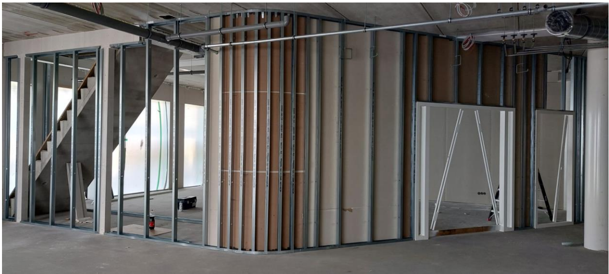
1 e lokaal! Onderwijsroute mens&, herkenbaar aan de ronde muur.